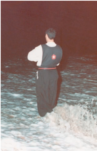
Entrega de parte de las cenizas al mar.